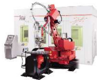
ファイバーレーザー溶接システム