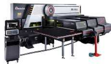
ファイバーレーザー・パンチ複合マシン